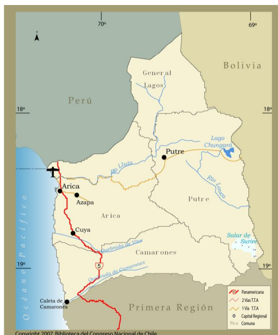
Figura N° 3. Mapa de la región de Arica y Parinacota.

Es importante precisar que, ante la reciente puesta en marcha de la Región de Arica y Parinacota, y con ella la instalación de sus servicios públicos, existen algunas dificultades para la obtención o generación de información relevante para el diseño de políticas, que se pueden resumir en dos aspectos: